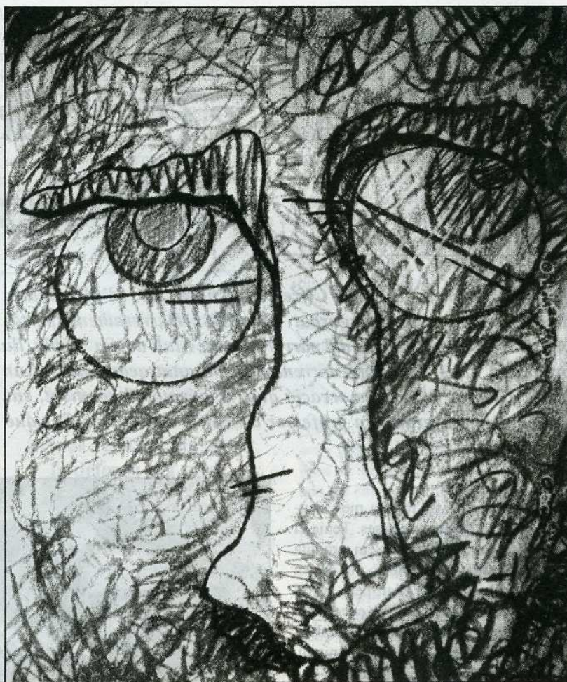
"Autoretrat. Sèrie Esquizofrènia", 1985.